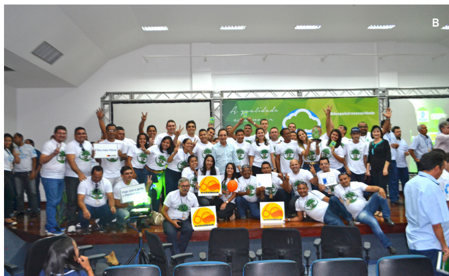
B. Gestores e colaboradores comemorando o PMQAR 2016